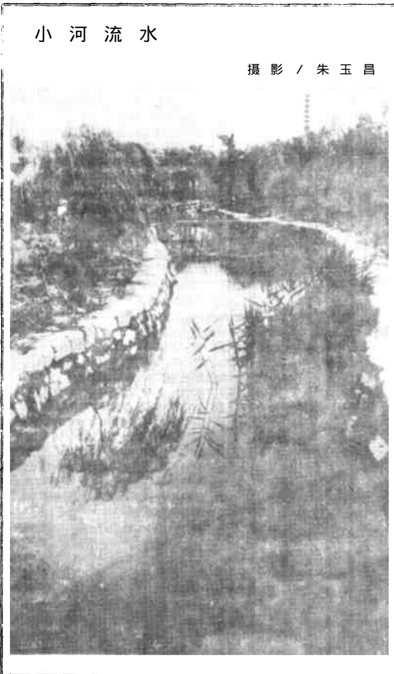
小河流水

(上接第一版)各界人士关心;二是靠政协组织和委员良好的精神状态、积极主动开展工作的政治热忱,提出意见、建议的针对性、科学性。