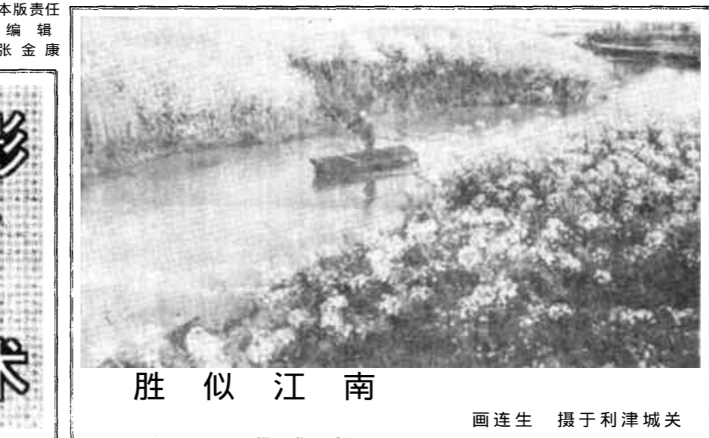
胜似江南 画连生 摄于利津城关