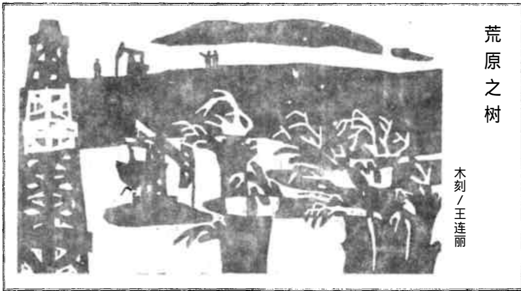
荒原之树 木刻/王连丽