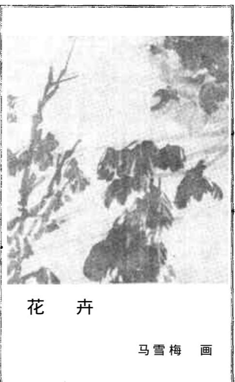
花卉 马雪梅 画