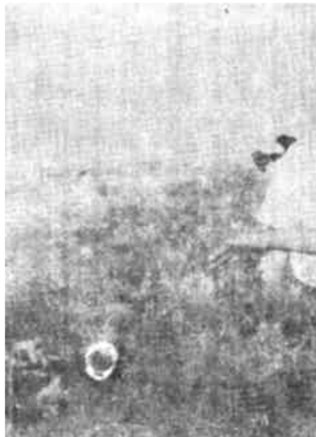
利津县公路局大力加强干线公路绿化,在含盐量6—7‰高盐路段普遍种植了柃柳,使公路绿化率达到94%,从而加固了公路边坡,减少了公路水毁,保证了行车安全,又美化了环境。图为县公路局领导与省公路局领导一起现场研究公路绿化。(王学钧)

大王镇建设的迅猛发展是农村市场经济发展的必然产物。改革开放以来,大王的乡镇企业飞速发展,非农业产值已大大超过了农业产值,农村的经济结构发生了历史性的变化,为小城镇建设奠定了较强的基础,形成先市、后镇、城、市并进的格局。小城镇又是城乡一体化的载体,对市场的培育起着重要的网络推进作用。经过农村改革已经逐步富裕起来的新时代农民,已不满足于“五间瓦房一壶酒,老婆孩子热炕头”的生活方式,而小城镇的兴起为他们开拓了新的更加美好的生活空间,使他们在离土不离乡的前提下,对生活方式开始有了新的选择。 大王镇委、镇政府一班人对建设与发展小城镇的认识不断提高。他们审时度势,按照“超前性、科学性、创新性”相结合,“经济、社会、环境、效益相统一”的原则,聘请山东省规划设计院编制了高水准的小城镇发展蓝图。依据规划,2000年前,大王镇将建成以机构、化工、轻工、电子为主,集工贸于一体的,具备中等县城规模,拥有5万人口的设施配套,经营繁荣花园式小城镇。 为了加快小城镇建设速度,镇里在机构编制紧张的情况下,设立了规划建设科,负责协调管理城镇规划建设工作。适应小城镇建设的需要,镇里调整了工业发展规划,出台了新的城镇户口管理制度、土地管理制度、农村购房基金制度,引导企业职工和有条件的农民在城区投资、建房、务工、经商,优惠的政策促使城镇人口迅速聚集,现已达3万余人,城镇的建设规模和速度日益加快。 大王镇建设的丰硕成果,为大王农民描绘了一幅农村城市化的美好蓝图,也引起了各级政府和领导的关注。今年,大王镇被列为全国小城镇试点建设镇。同时,小城镇建设优化了投资环境,对外商投资产生了较强的吸引力,外商纷至沓来,经济跳跃式发展,预计今年社会总产值可突破5亿元大关。也涌现了象东营纸业、信义集团、科达股份有限公司等有实力的合资企业。可以预见,经过大王人的不懈奋斗,大王小城镇建设的美丽画卷会越来越清晰地展现在世人面前,圆起世代大王人的城市梦。