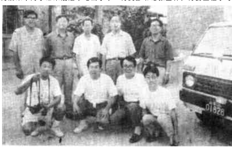
压题照片为渔船待潮出海。左图为报社领导同志参加采访的部分同志送行。