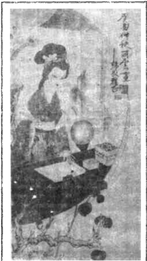
仕女图 张丽云 画