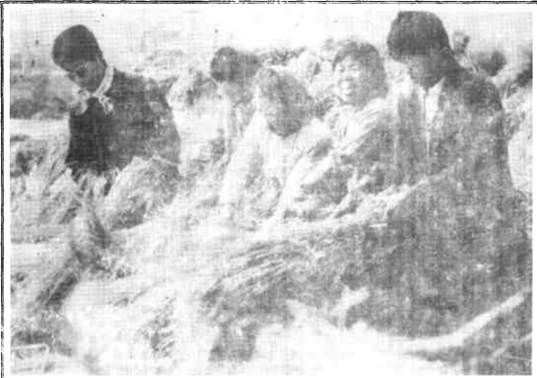
笑满打谷场