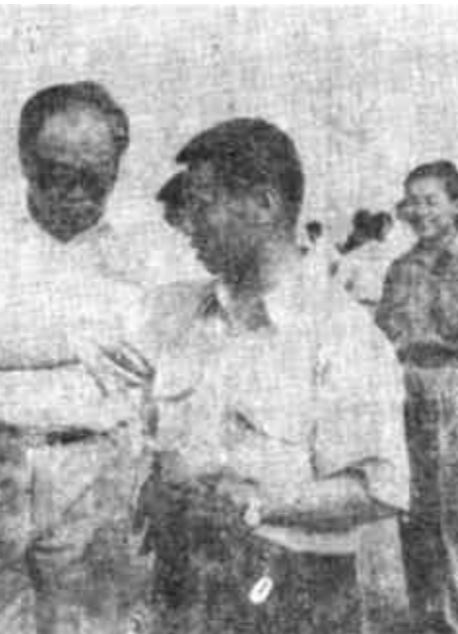
利津县公路局大力加强干线公路绿化,在含盐量6—7‰高盐路段普遍种植了柃柳,使公路绿化率达到94%,从而加固了公路边坡,减少了公路水毁,保证了行车安全,又美化了环境。图为县公路局领导与省公路局领导一起现场研究公路绿化。(王学钧)

多方联合引进高新技术 蓬莱乡镇企业“鸟枪换炮” 蓬莱市采取多种措施引进高新技术,力促乡镇企业上档次,现已初步形成了以电子信息、生物工程技术等为主导行业的格局。 他们的具体做法:一是实行厂校挂钩,直接引进高新技术。大季家镇轧钢厂与清华大学挂钩,成功地把引进的技术应用到生产中,使该厂的膜式水冷壁扁钢的质量达到国际先进水平,成为替代进口产品。二是厂所挂钩,建立高新技术试验基地。到目前,全市共有40多个企业通过挂靠联合建立了高新技术试验基地。蓬莱市海珍品实业总公司先后与国家水产局黄海水产所合作,共同承担了各类科研项目16个,有8项获得国家、省科技进步奖。三是直接采用专利技术,开发高新技术产品。登州镇刘家庄村先后在北京、上海等大中城市设立了专利开发信息点,到1993年底,共引进实施专利技术17项,专利产品产值达1200万元,创收税280万元。(摘自《大众日报》)